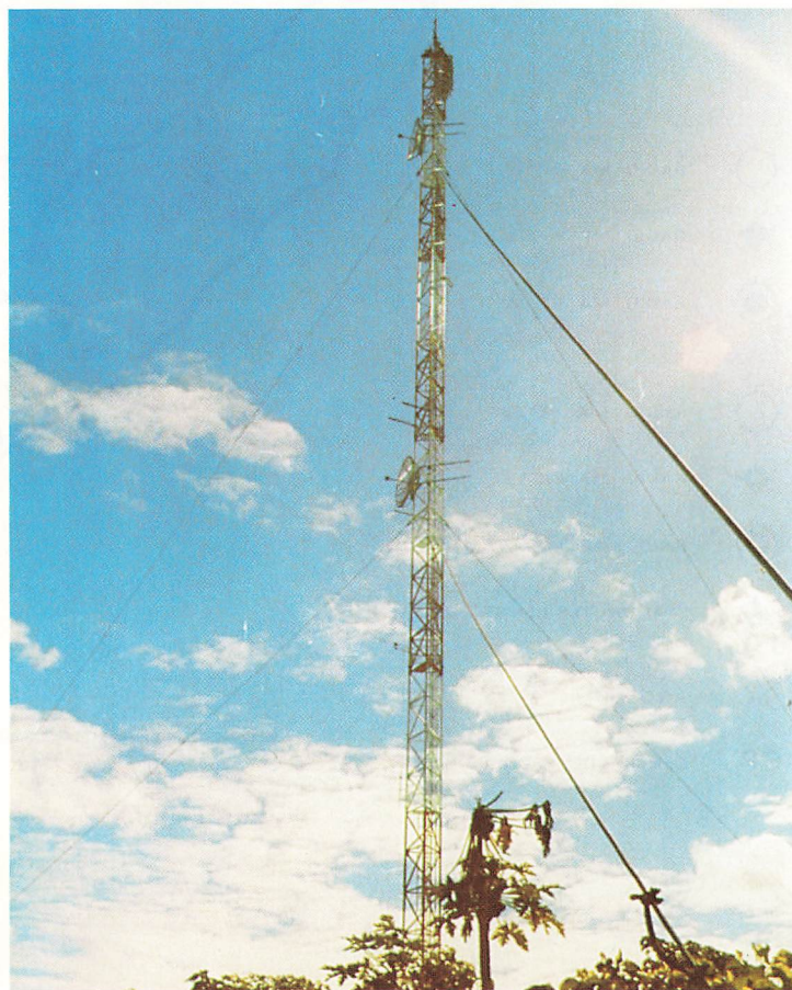
Pylône du centre TV de NAWAGUED à LIFOU (Iles LOYAUTÉ)