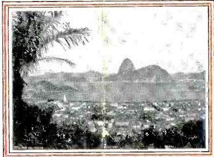
Rio de Janeiro - Vista de Botafogo e Pão de Assucar Rio de Janeiro - View of Botafogo and Sugar Loaf