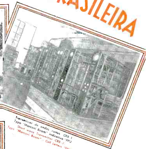
Transmissor de ondas curtas CRB 1 Tipo "Marconi Beam" indicativo PPO Short wave Transmitter CRB-1 Type "Marconi Beam" - Call Letters "PPO"